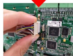
DTN-CAD-150-2-MB/ 4/ 8/ 8-plus